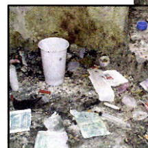
Porat pomaže onima koji svjesno žele iz pakla droge

Udruga "Porat" ima šestero mladih osnivača i stalnih članova, koji jednom na tjedan održavaju sastanke u Centru čije im je